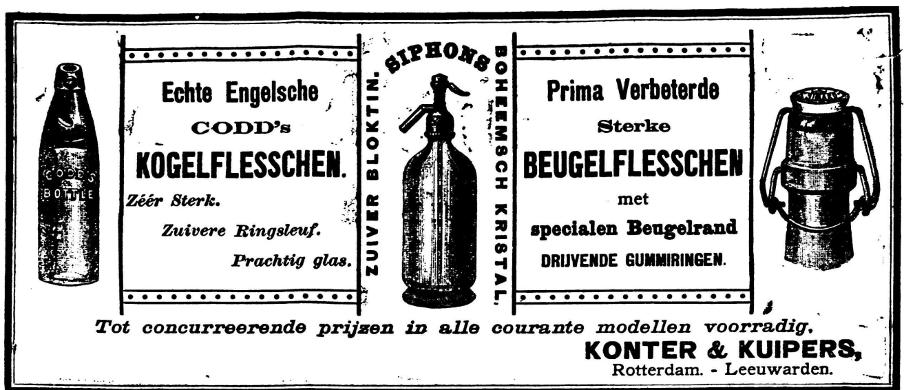
Advertentie Leeuwarder Courant , 19 mei 1898.